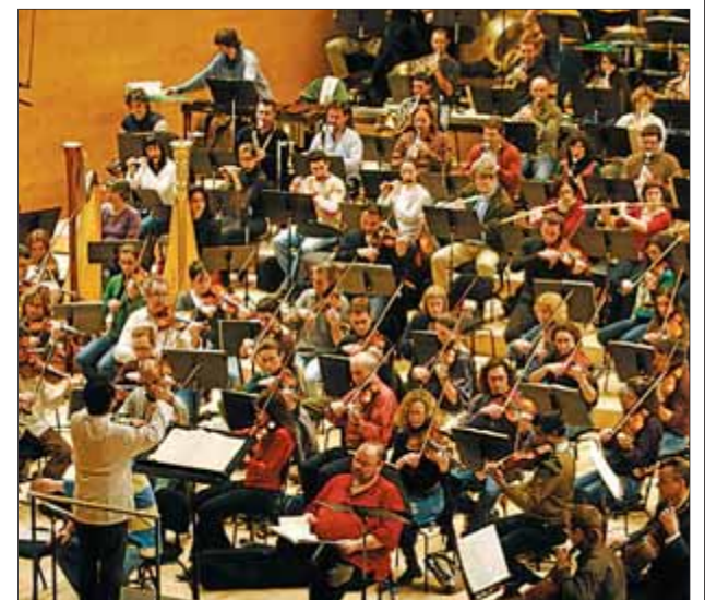
L'OBC i quatre cors catalans interpreten aquest cap de setmana el 'Gurre-Lieder' d'Arnold Schönberg ■ MARTA PÉREZ

Per Alfaya, "sempre és difícil programar Schönberg, però crec que és una gran obra, més accessible per al gran públic per la seva temàtica èpica i un estil molt influït encara per Wagner". ■