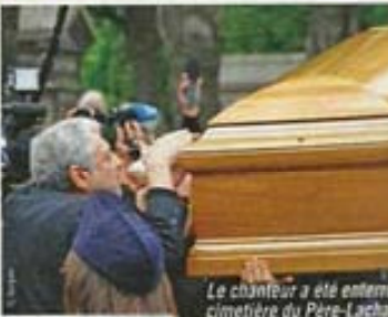
Le chanteur a été enterré au cimetière du Père-Lachaise. À quelques mètres de la tombe de Piaf, Enrico Macias lui rend un dernier hommage lors du passage du cercueil.