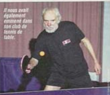
Il nous avait également emmené dans son club de tennis de table.