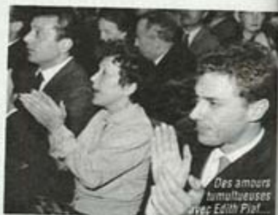
Des amours tumultueuses avec Edith Piaf...

Georges Moustaki avait arpenté tous les méridiens, toutes les cultures, toutes les langues. « Il n'existe aucune notion de patrie en moi. Ma patrie, à la rigueur, c'est la Méditerranée », disait-il. Il se sentait si peu d'appartenances qu'il attendra quarante ans pour apprendre le grec et cinquante pour demander la nationalité française, alors qu'il vivait dans le pays depuis ses 17 ans. C'est à Alexandrie d'Égypte qu'il naît, le 3 mai 1934, de parents grecs. Giuseppe pour la sage-femme, Yusef pour l'état civil, Joseph pour son instituteur, et Yousif sur son passeport grec, il se choisit finalement le prénom de Georges en hommage à son modèle et inspirateur, Georges Brassens, qui lui mettra le pied à l'étrier. En 1954, trois ans après son arrivée en France, il fait la connaissance d'Henri Salvador, qui le prend pour un ami d'enfance de sa femme, égyptienne elle aussi. Peu convaincant comme chanteur, il écrira pour lui comme pour d'autres - Pia Colombo, Juliette Gréco, Tino Rossi -