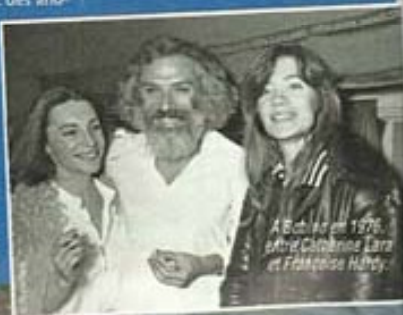
A Bob' au en 1976, avec Catherine Lara et Françoise Hardy.

ya deux ans avec humour dans son autobiographie. « Avec Moustaki, c'était surtout une histoire d'amitié. Mais un soir, à force de me faire la cour, il m'a fait le jardin. » La chanteuse tombera alors enceinte, mais ne désirant pas d'enfant, elle préfère avorter. (F.Ser)