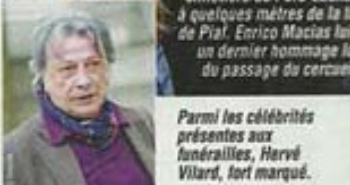
Parmi les célébrités présentes aux funérailles, Hervé Vilard, fort marqué.