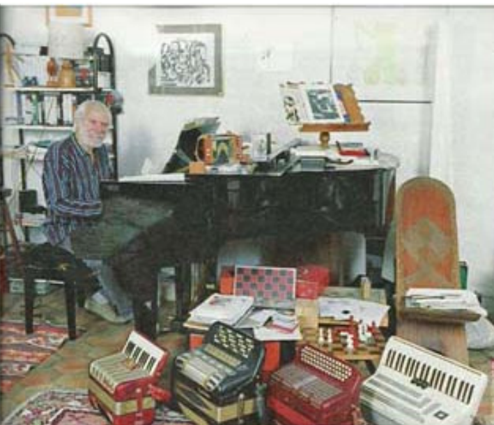
Il nous avait reçu chez lui en 2000, dans son appartement parisien, sur l'île Saint-Louis, où tout était dédié à la musique.