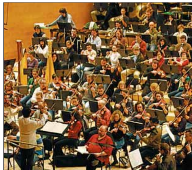
L'OBC i quatre cors catalans interpreten aquest cap de setmana el 'Gurre-Lieder' d'Arnold Schönberg

Per Alfaya, "sempre és difícil programar Schönberg, però crec que és una gran obra, més accessible per al gran públic per la seva temàtica èpica i un estil molt influït encara per Wagner". ■